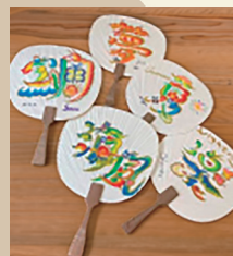
花文字会 絵画・書・絵文字