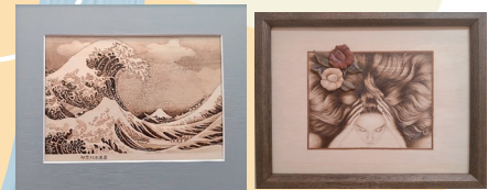
しまりすアートクラブ ウッドバーニング