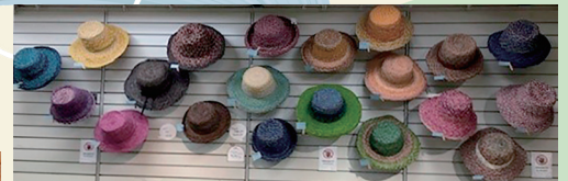
ラフィアサロン新百合ヶ丘 ラフィア編みの帽子