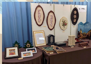
ル・グラン デコパージュ