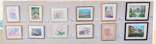
しんゆりスケッチの会 水彩画