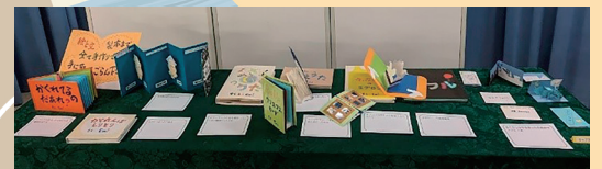
絵本工房サニーフィッシュ 手作り絵本