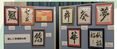
楽しく書道静山会 書道作品