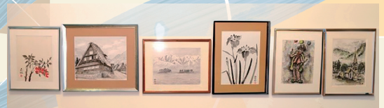
墨遊会 墨彩画・チョークアート