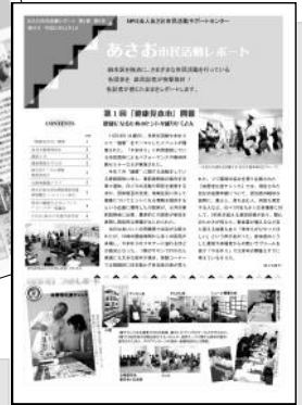
あさお市民活動レポートは年4回発行