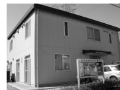
市民交流館やまゆり

神奈川県川崎市麻生区上麻生1-11-5 Tel. 044-951-6321 FAX. 044-951-6467 開館時間 月～金 9:30～17:00 ※平日夜間・土日でも予約すれば利用可 休館日 祝日、年末年始(12/29～1/3)、施設点検日