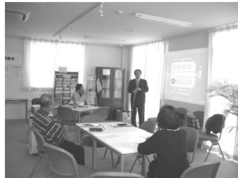
やまゆりで、事前プレゼンテーションを実施 いずれも内容の濃い講座が無料で！