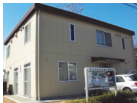
市民交流館やまゆり